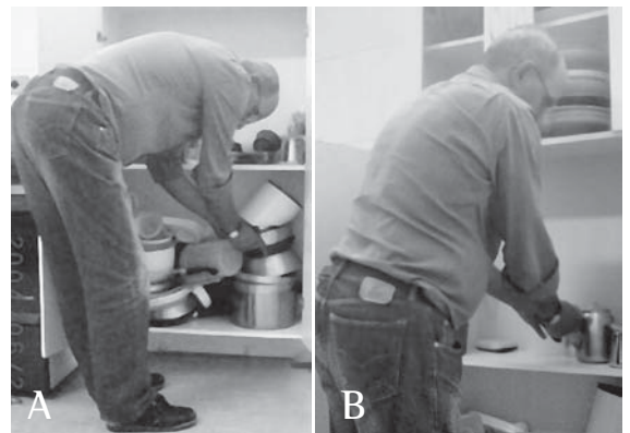
Figura 4 - A) Paciente realizando a atividade de guardar utensílios em prateleiras baixas sem a utilização das técnicas de conservação de energia; B) Paciente realizando a atividade de guardar utensílios em prateleiras baixas utilizando as técnicas de conservação de energia