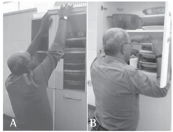
Figura 3 - A) Paciente realizando a atividade de guardar utensílios em prateleiras altas sem a utilização das técnicas de conservação de energia; B) Paciente realizando a atividade de guardar utensílios em prateleiras altas utilizando as técnicas de conservação de energia