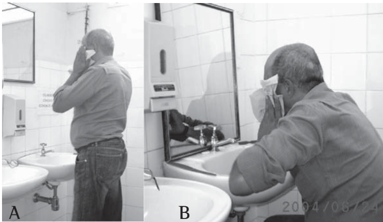
Figura 1 - A) Paciente realizando as atividades de higiene pessoal sem a utilização das técnicas de conservação de energia; B) Paciente realizando as atividades de higiene pessoal utilizando as técnicas de conservação de energia

Outras soluções podem ser encontradas para