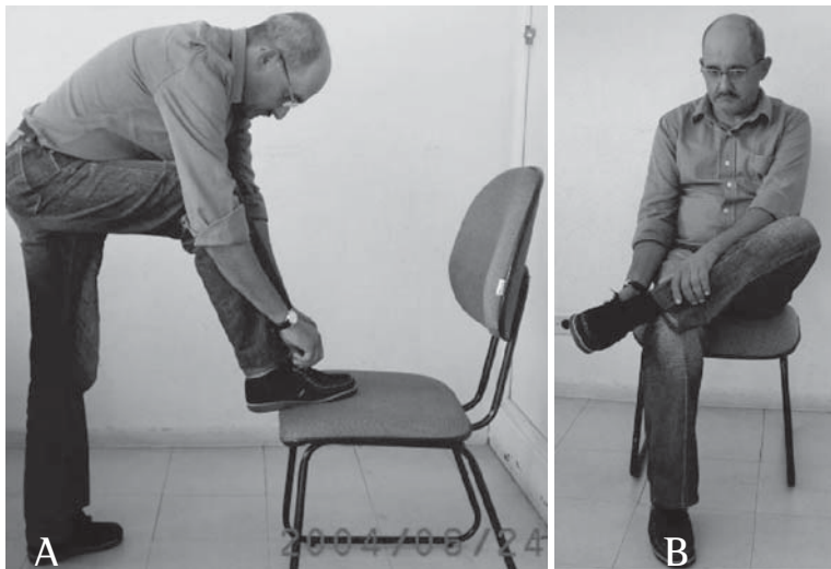
Figura 2 - A) Paciente realizando a atividade de colocar sapatos sem a utilização das técnicas de conservação de energia; B) Paciente realizando a atividade de colocar os sapatos utilizando as técnicas de conservação de energia