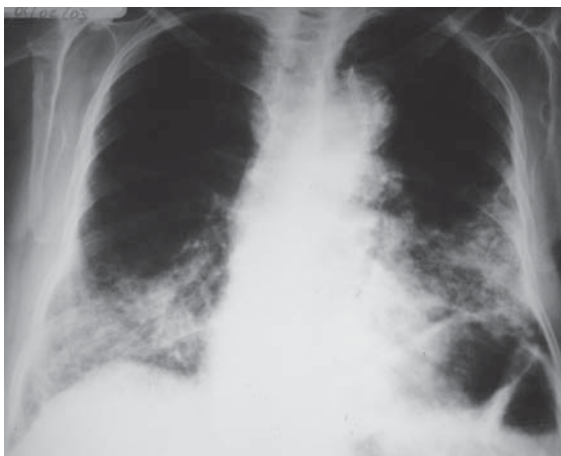
Figura 1 - Radiografia simples do tórax em pósterio-anterior, mostrando opacificações bilaterais, de predomínio basal

A pneumonia lipóide é uma entidade rara, resultante da microaspiração de emulsões lipídicas. (1)